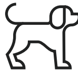
PES MÀXIM 15 KG